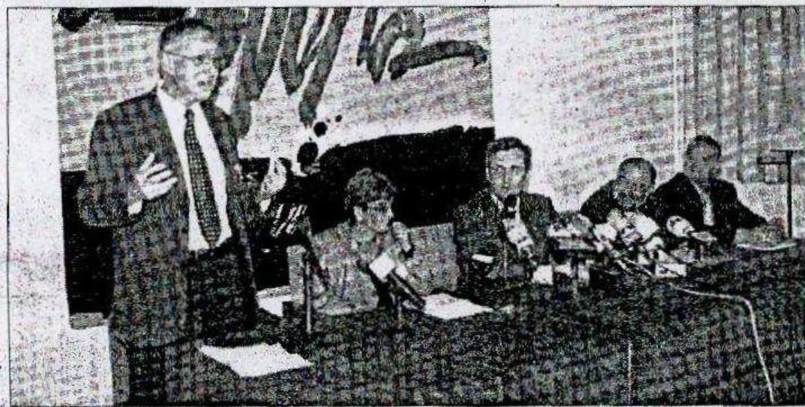
En las imágenes, dos momentos del acto inaugural de los telescopios Magic y Mercator .

los dos telescopios. El mal tiempo restó brillantez a ambas ceremonias, que fueron más breves de lo inicialmente previsto.